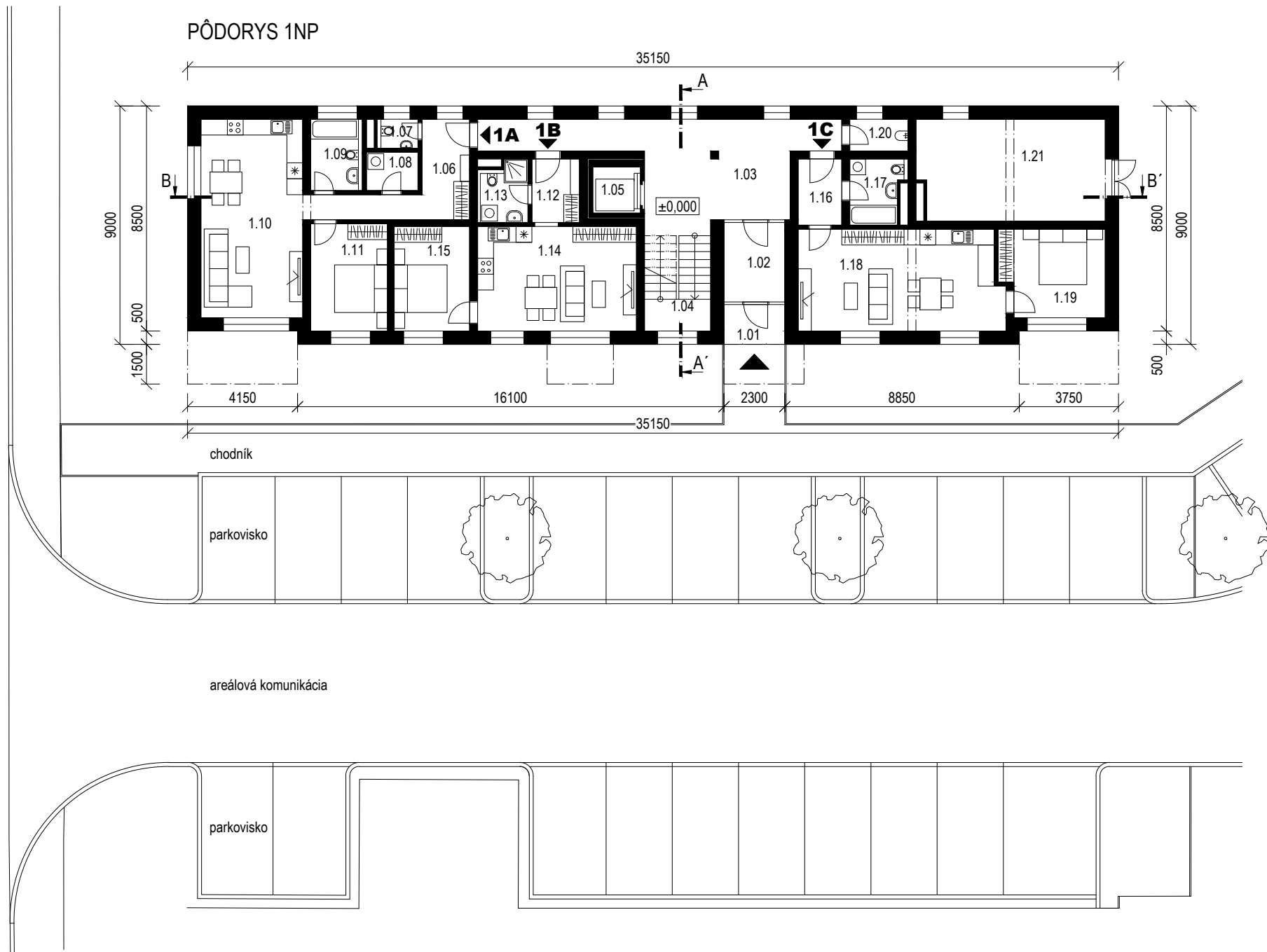
Tabuľka miestností 1.NP